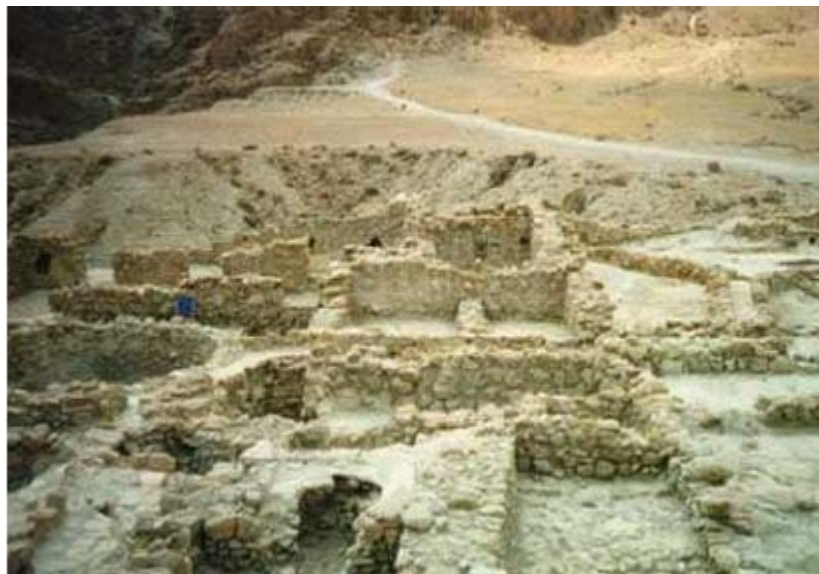
Excavaciones de Qumran.

El cementerio proporcionó restos humanos de hombres en el denominado cementerio principal y restos indistintos, de hombres, mujeres y niños, en el anejo. Esta división de los cementerios en dos es producto de una idea original de Roland de Vaux – defendiendo la idea del celibato a ultranza de la comunidad-, pero hay autores que la critican, señalando que el cementerio está construido así por necesidades derivadas de la topografía. En total hay 1200 tumbas orientadas de norte a sur, al contrario a como la religión hebrea suele realizarlas. Hay restos de tela, algún que otro adorno y monedas. Estas últimas han aparecido en distintos puntos de las ruinas 39 .